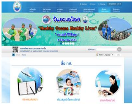
เว็บไซต์ www.dmcrth.go.th หัวข้อ "กระดานสนทนา"