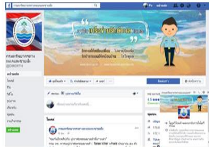
Facebook กรมทรัพยากรทางทะเลและชายฝั่ง และ Facebook ส่วนส่งเสริมและพัฒนาทรัพยากรทางทะเลและชายฝั่ง