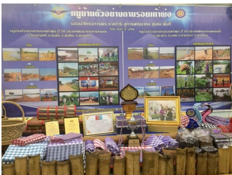
ภาพที่ 5 โครงการหมู่บ้านตัวอย่างตามรอยเท้าพ่อ

ชุมชนในพื้นที่ให้มีภูมิคุ้มกัน มีความเป็นอยู่ที่ดีตามเกณฑ์ความจำเป็นพื้นฐาน (จปฐ.) และสามารถพึ่งพาตนเองได้อย่างยั่งยืน ตามปรัชญาเศรษฐกิจพอเพียง อาทิ ฟาร์มตัวอย่าง อันเนื่องมาจากพระราชดำริในสมเด็จพระนางเจ้าฯ พระบรมราชินีนาถ บ้านปียา ซึ่งเป็นโครงการในพื้นที่ 3 จังหวัดชายแดนใต้ โดยมีวัตถุประสงค์หลักเพื่อเป็นแหล่งจ้างงาน ช่วยเหลือชาวบ้านยากจนให้ได้มีอาชีพ สร้างความสามัคคีระหว่างราษฎรกลุ่มไทยพุทธ และกลุ่มไทยมุสลิมให้เข้มแข็ง มั่นคง นอกจากนี้ยังมีโครงการพัฒนาด้านสาธารณสุข ปลอดภัย แหล่งน้ำเพื่อการเกษตรกรรม ปศุสัตว์ และการอนุรักษ์ป่าต้นน้ำและทรัพยากรธรรมชาติ งานก่อสร้างปรับปรุงเส้นทางคมนาคมเพื่อขนส่งผลผลิตทางการเกษตรสู่ชุมชนได้สะดวก