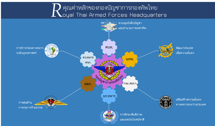
ภาพที่ 6 คุณค่าหลักของกองบัญชาการกองทัพไทย

ด้วยภาวะผู้นำที่เข้มแข็ง และการขับเคลื่อนการนำองค์การอย่างเป็นระบบ ส่งผลให้กองบัญชาการกองทัพไทย มีผลงานเป็นที่ประจักษ์อย่างชัดเจนทั้งด้านการเป็นองค์กรชั้นนำที่ทันสมัยในการอำนวยความสะดวกด้านการป้องกันประเทศ และการปฏิบัติการทางทหารเพื่อความมั่นคง รวมถึงงานด้านการสนับสนุน ช่วยเหลือชุมชนในการพัฒนาศักยภาพและคุณภาพชีวิตให้สามารถพึ่งพาตนเองได้ตามแนวทางปรัชญาเศรษฐกิจพอเพียง นับเป็นการปฏิบัติการทางทหารระดับยุทธศาสตร์ที่ส่งผลต่อความสำเร็จที่สำคัญยิ่ง ทำให้กองบัญชาการกองทัพไทย สามารถผลักดันองค์การ ให้สร้างผลงานที่ก่อให้เกิดผลลัพธ์ต่อประเทศชาติ ประชาชน อย่างต่อเนื่องและยั่งยืน