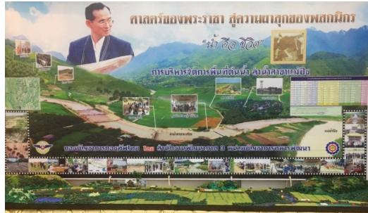
ภาพที่ 4 โครงการบริหารจัดการพื้นที่ต้นน้ำลำน้ำสาขาแม่ปิง

“คืนความสุขแก่ประชาชน” โดยมีเป้าหมายให้ประชาชนเกิดความเชื่อมั่น ศรัทธา เกิดความรักหวงแหนผืนแผ่นดินของตนเอง มีความรักชาติ เทิดทูนสถาบันพระมหากษัตริย์ และพร้อมให้ความร่วมมือกับกองทัพไทย ซึ่งจะส่งผลให้เกิดความมั่นคงในพื้นที่ โดยกองบัญชาการกองทัพไทยได้สนับสนุนงานพัฒนาประเทศร่วมกับทุกภาคส่วนราชการเพื่อพัฒนาศักยภาพของ