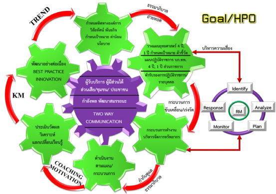
ภาพที่ 1 ระบบการนำองค์กรของกองบัญชาการกองทัพไทย

มีการสื่อสารถ่ายทอดแผนสู่การปฏิบัติอย่างเป็นระบบที่เน้นการมีส่วนร่วมของผู้บริหารทุกระดับ โดยมีการมอบอำนาจและกระจายอำนาจการตัดสินใจตามสายการบังคับบัญชา เพื่อให้กำลังพลทุกนายรับทราบทิศทางขององค์กร โดยเน้นการสื่อสารแบบสองทาง เพื่อให้เกิดความเข้าใจในทิศทางเดียวกันทั้งรูปแบบที่เป็นทางการ เช่น การมอบโอวาทใน