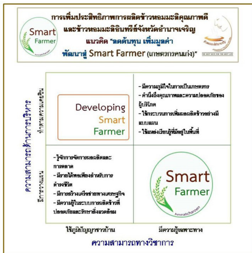
ภาพที่ 3 ลดต้นทุน เพิ่มมูลค่า พัฒนาสู่ Smart Farmer