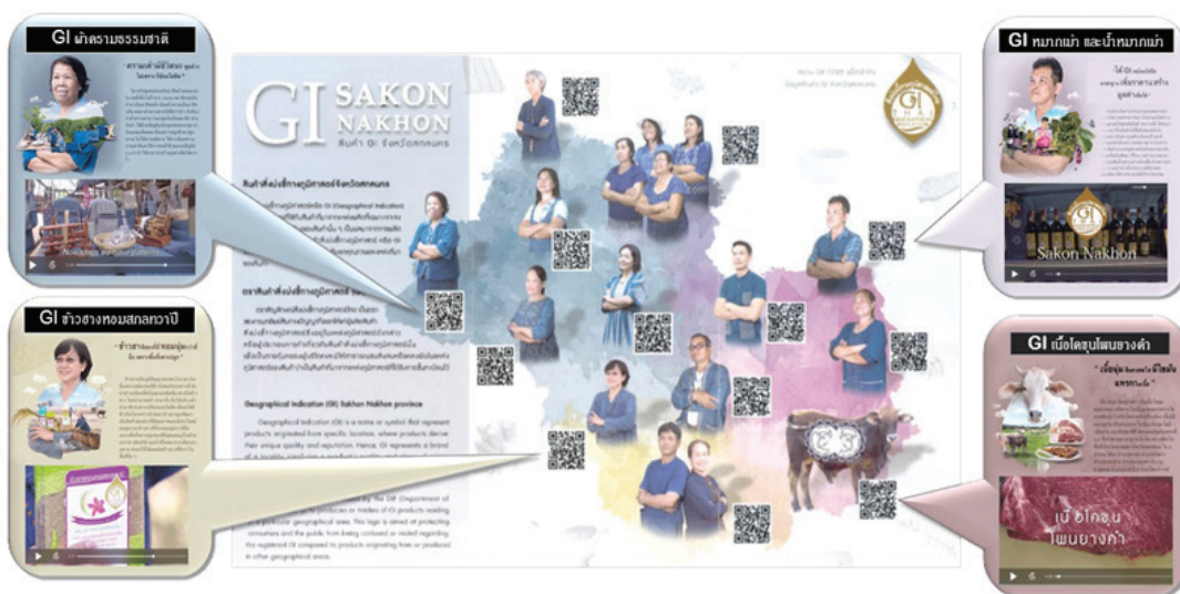
ภาพที่ 4 การใช้เทคโนโลยี QR code นำเสนอสินค้า GI ของจังหวัดสกลนคร

คราม : ผ้าครามธรรมชาติสกลนคร ซึ่งทั้งฝ้ายและครามที่นำมาประกอบเป็นผืนผ้าต้องปลูกในจังหวัดสกลนครเท่านั้น ผ่านกระบวนการย้อมครามธรรมชาติตามภูมิปัญญาท้องถิ่น จึงจะทำให้ได้ผืนผ้าที่มีสีฟ้าอ่อนถึงสีน้ำเงินเข้ม เป็นมันวาว สีไม่ตก มีกลิ่นเฉพาะตัว