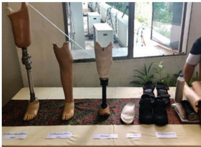
โรงงานขาเทียมพระราชทาน โรงพยาบาลรามัน