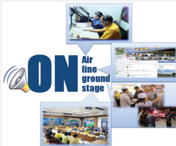
ช่องทางหลักในการสื่อสารของผู้บริหาร

นอกจากนี้ ยังจัดทำวารสารยะลาสันติสุข การจัดทำเอกสารข่าวของส่วนราชการ เพื่อเผยแพร่ประชาสัมพันธ์ผลงานของจังหวัดยะลา รวมทั้ง ยังจัดให้มีช่องทางการรับฟังความคิดเห็นและข้อร้องเรียนผ่านช่องทางศูนย์ดำรงธรรมจังหวัดยะลา ศูนย์อำนวยความสะดวก เป็นธรรมอำเภอ และหน่วยบริการจังหวัดเคลื่อนที่ทุกเดือน