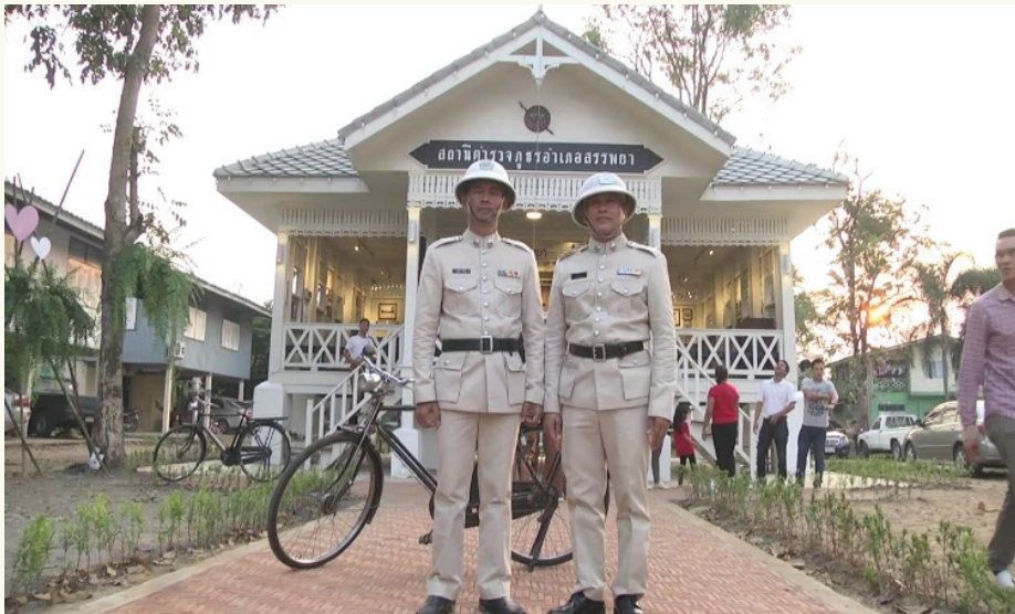
ภาพที่ 3 สถานีตำรวจภูธรอำเภอสรรพยา

เที่ยววิถีชุมชน คนสาปยา จังหวัดชัยนาทให้ความสำคัญกับการพัฒนาการท่องเที่ยว โดยมีเป้าหมายให้การท่องเที่ยวเติบโตขึ้น นอกเหนือจากภาคการเกษตรที่เป็นรายได้หลักของจังหวัด ชุมชนสาปยาเป็นชุมชนที่มีความเข้มแข็ง มีต้นทุนทางวัฒนธรรม มีอาคารโรงพักเก่าสร้างในสมัยรัชกาลที่ 5 (ร.ศ.120) ยังมีตลาดเก่าสรรพยาที่ยังคงวิถีชีวิตดั้งเดิม ถือได้ว่าเป็นแหล่งท่องเที่ยวพร้อมที่จะพัฒนาแบบมีส่วนร่วมโดยชุมชน ดังนั้น จังหวัดชัยนาท โดยความร่วมมือของคนในชุมชน องค์กรปกครองส่วนท้องถิ่น และภาคเอกชน ดำเนินการพัฒนาแหล่งท่องเที่ยวเมืองสาปยา โดยบูรณะอาคารโรงพักเก่าเพื่อใช้เป็นอาคารพิพิธภัณฑ์ จัดแสดงประวัติศาสตร์ท้องถิ่นสรรพยา เพื่อให้เป็นแหล่งเรียนรู้สำหรับคนในชุมชน และนักท่องเที่ยวจนได้รับรางวัล “อนุรักษ์ศิลปะสถาปัตยกรรมดีเด่น” ประเภทอาคารจากสมาคมสถาปนิกสยามในพระบรมราชูปถัมภ์ รวมถึงรางวัล “วัฒนคุณากร” จากกระทรวงวัฒนธรรม และรางวัลชนะเลิศ “การแข่งขันจัดทำข้อมูล Digital” ด้านการท่องเที่ยวที่มีคุณภาพระดับประเทศจากกระทรวงการท่องเที่ยวและกีฬา