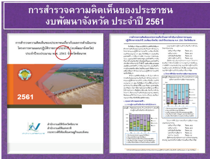
ภาพที่ 4 การประเมินผลสัมฤทธิ์ของโครงการโดยการสำรวจความคิดเห็นของประชาชน ผู้มีส่วนได้ส่วนเสีย

จากความสำเร็จเปรียบเชิงยุทธศาสตร์ที่มีสภาพภูมิประเทศ ทรัพยากรดิน น้ำอุดมสมบูรณ์ ประชาชนมีวิถีชีวิตแบบดั้งเดิม นำมากำหนดเป็นจุดยืนทางยุทธศาสตร์ในการส่งเสริมศักยภาพด้านการเกษตร ท่องเที่ยว สังคม และสิ่งแวดล้อม นำมาวางแผนยุทธศาสตร์บนฐานข้อมูล และนำไปสู่การปฏิบัติผ่านกลไกการมีส่วนร่วมของส่วนราชการและชุมชนในพื้นที่จนมีผลลัพธ์เชิงประจักษ์ที่สร้างชื่อเสียงให้จังหวัด สร้างรายได้ และความสุขให้ประชาชน ดังจะเห็นได้จาก ปี 2561 จังหวัดชัยนาทได้อันดับที่ 13 ของประเทศในการจัดอันดับความสุขของคนไทย