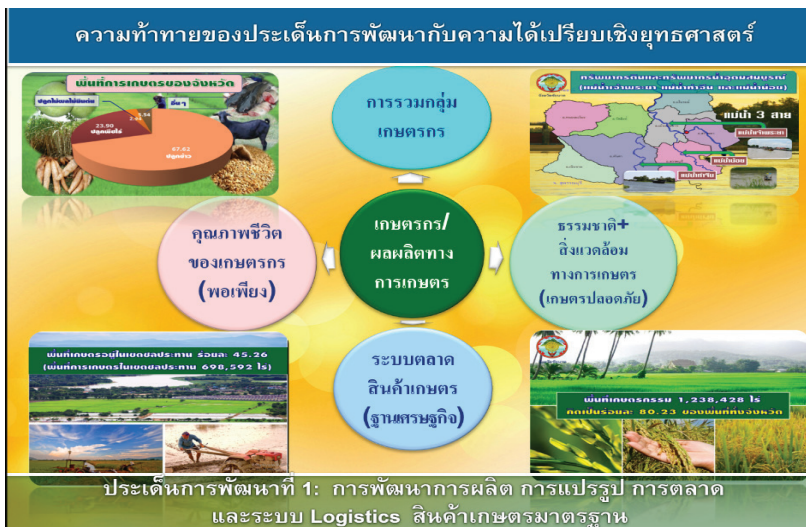
ภาพที่ 1 การวิเคราะห์ประเด็นการพัฒนาจากความท้าทายและความได้เปรียบเชิงยุทธศาสตร์

ด้านสังคมและคุณภาพชีวิต รวมถึงการกำหนดตัวชี้วัดแผนพัฒนาจังหวัดที่มีความชัดเจน วัดผลได้ มีการรวบรวมฐานข้อมูลย้อนหลังที่สามารถนำมาใช้ในการคาดการณ์เป้าหมายในอนาคต และสอดคล้องกับตัวชี้วัดของกระทรวง ทำให้สามารถบูรณาการงานและงบประมาณกับทุกภาคส่วนในจังหวัด มีการวิเคราะห์เป้าหมายการพัฒนาโดยกำหนดความท้าทายเชิงยุทธศาสตร์ (Strategic Challenge: SC) ในแต่ละประเด็นการพัฒนาที่สอดคล้องกับความได้เปรียบเชิงยุทธศาสตร์ (Strategic Advantage :SA) เพื่อนำไปสู่การบรรลุเป้าหมายการพัฒนาของจังหวัดทั้งในด้านส่งเสริมการเกษตรให้ได้มาตรฐาน เพิ่มศักยภาพด้านการท่องเที่ยว บริหารจัดการการใช้ทรัพยากรธรรมชาติอย่างสมดุลและยั่งยืน รวมถึงพัฒนาคุณภาพคนและสร้างสังคมให้เป็นสุข