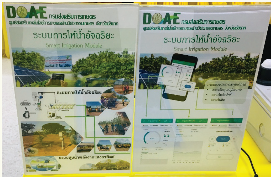
ภาพที่ 2 ระบบการให้น้ำอัจฉริยะ