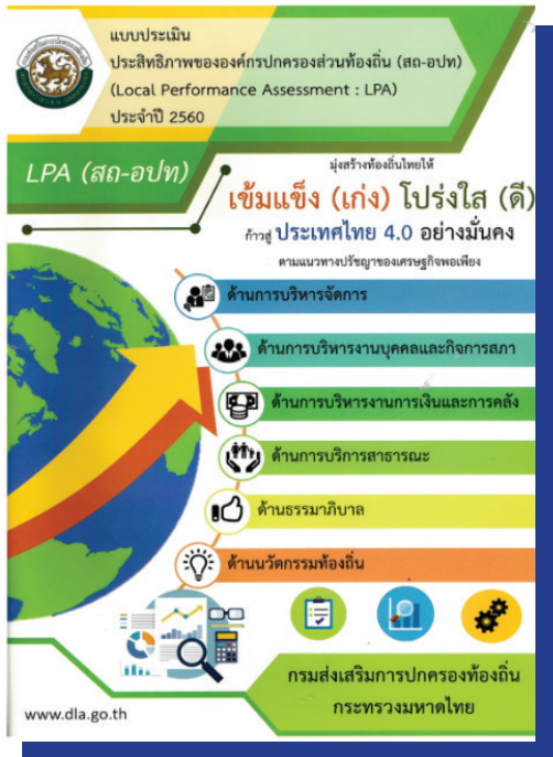
แบบประเมินประสิทธิภาพ

การส่งเสริมให้ อปท. จัดทำรายงานผลกระทบด้านสิ่งแวดล้อมเบื้องต้น (IEE) หรือรายงานการวิเคราะห์ผลกระทบด้านสิ่งแวดล้อม (EIA) ภายหลังจากก่อสร้างโรงงานกำจัดขยะเพื่อผลิตกระแสไฟฟ้า เป็นต้น ด้านองค์การ มีการกำหนดระบบการติดตามประเมินผลการดำเนินงานของ อปท. ในรูปแบบของการประเมินประสิทธิผลขององค์กรปกครองส่วนท้องถิ่น (Local Performance Assessment (LPA)) โดยมีการประเมินมาอย่างต่อเนื่องตั้งแต่ปี พ.ศ. 2549 และได้มีการพัฒนารูปแบบหลักเกณฑ์การประเมินให้มีความสอดคล้องกับนโยบายสำคัญของรัฐบาล โดยเป็นการประเมินประสิทธิภาพใน 6 ด้าน ได้แก่ ด้านการบริหารจัดการ ด้านงานบุคคลและกิจการสภา ด้านการเงินการคลัง ด้านการบริการสาธารณะ ด้านธรรมาภิบาล และด้านติดตามนวัตกรรมท้องถิ่น และได้ส่งเสริม