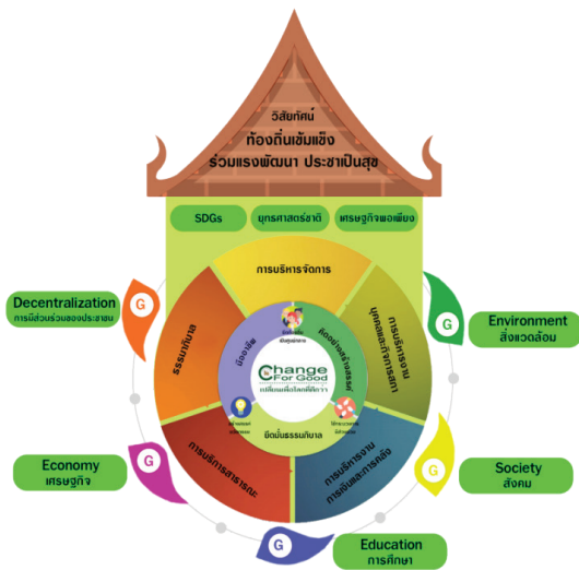
DLA 5G Model

ผู้บริหารกำหนดทิศทางและค่านิยมในการถือปฏิบัติ และการขับเคลื่อนยุทธศาสตร์ ไว้ว่า “อยากเห็น สถ. และ อปท. เป็นองค์กรที่มีสมรรถนะสูง สามารถทำหน้าที่เป็นเลิศ มีเป้าหมายสู่การเป็นหนึ่งด้วยธรรมาภิบาล สู่ท้องถิ่นเข้มแข็ง คนในสังคมร่วมแรงใจพัฒนา ประชาชนมีความสุข” จึงเป็นที่มาของวิสัยทัศน์ “ท้องถิ่นเข้มแข็ง ร่วมแรงพัฒนาประชาเป็นสุข” โดยนำองค์การที่มุ่งเน้นพัฒนาจากภายในสู่ภายนอก โดยใช้โมเดล DLA 5G เพื่อขับเคลื่อน “Change For Good” ใน 5 ด้าน ได้แก่