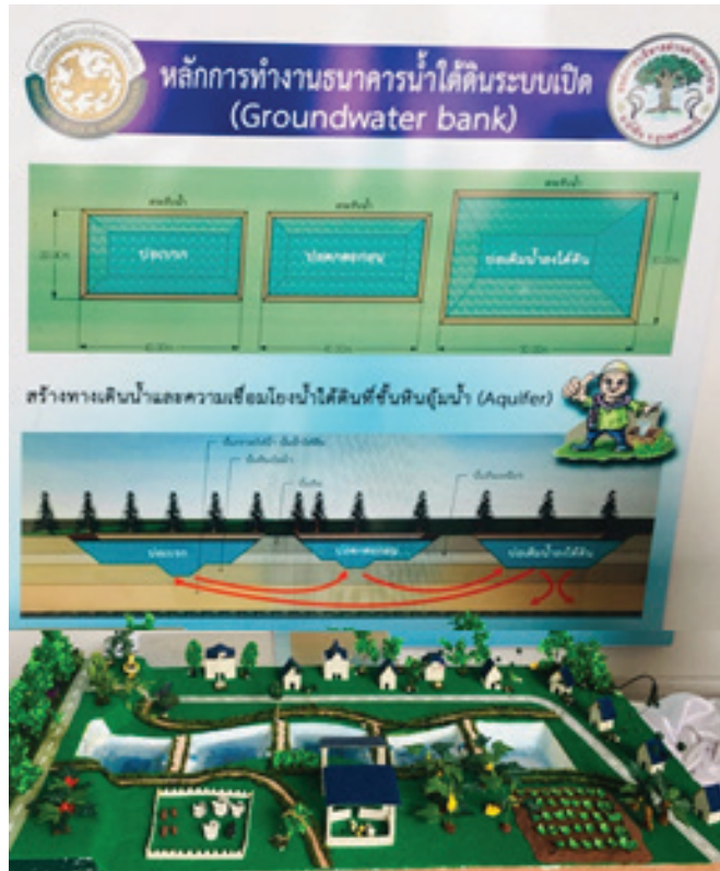
โมเดลธนาคารน้ำใต้ดิน

ภายใต้การนำองค์การด้วยทิศทางที่ชัดเจน “Change for Good : เปลี่ยนเพื่อโลกที่ดีกว่า” อีกทั้งการสื่อสารอย่างทั่วถึงในการกำกับดูแล ส่งเสริม สนับสนุน เพื่ออำนวยความสะดวกให้ อปท. สามารถทำงานได้คล่องตัวมากที่สุด ในการนำนโยบายจากรัฐบาลไปทำงานร่วมกับท้องถิ่น ขณะเดียวกันก็ได้นำ ปัญหาของท้องถิ่นมาประสานเพื่อดำเนินการกับรัฐบาล ผ่านกระบวนการมีส่วนร่วม ของชุมชนในแต่ละพื้นที่อย่างเข้มแข็งในการร่วมกันแก้ปัญหาและพัฒนาพื้นที่ ของตนเอง จนสามารถสร้างต้นแบบ และผลักต้นให้มีการนำไปขยายผล ลู่ท้องถิ่นต่าง ๆ ทั่วประเทศได้อย่างยั่งยืน