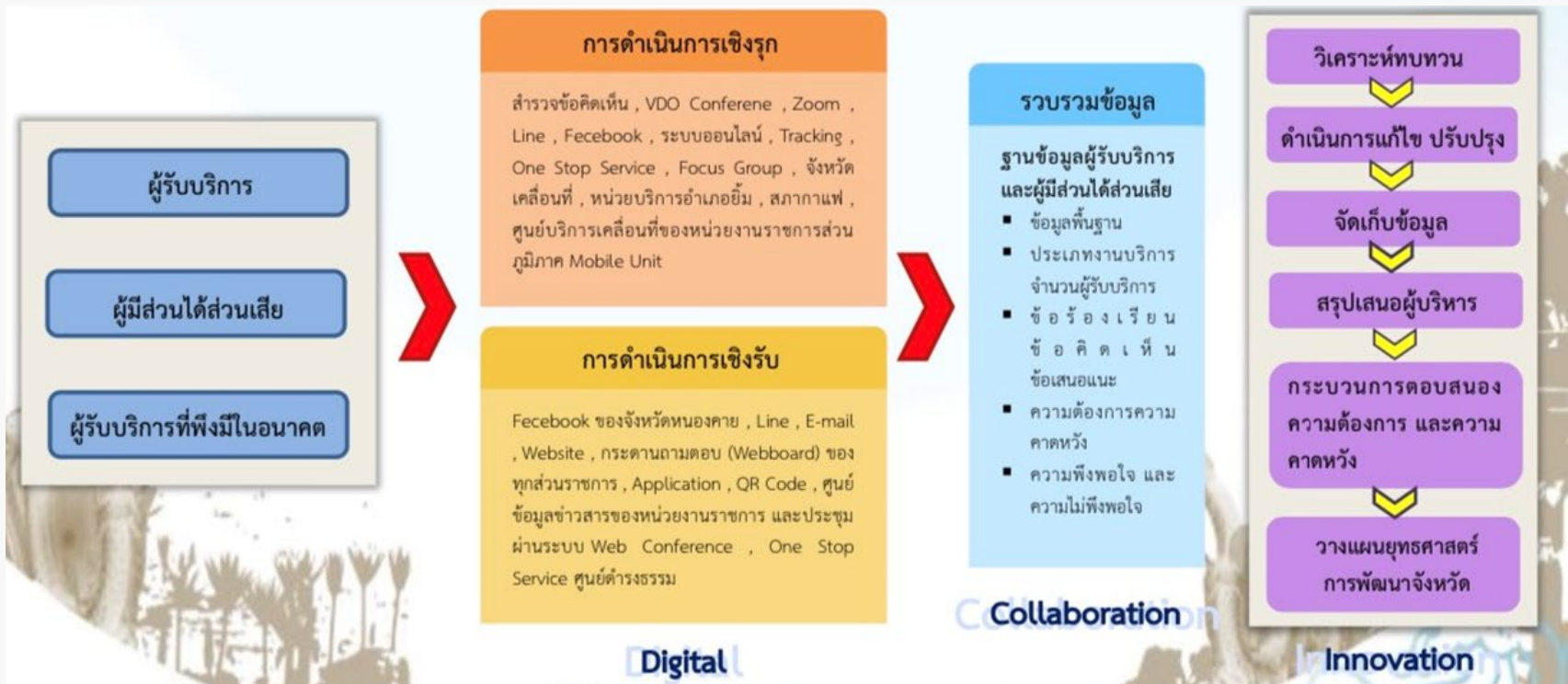
ระบบสารสนเทศผู้รับบริการและผู้มีส่วนได้เสีย จังหวัดหนองคาย

ในการให้บริการมีเป้าหมายเพื่อให้คนจังหวัดหนองคายได้รับการ “ดีกว่า ถูกกว่า เร็วกว่า และ มีความสุขมากกว่า” (Better - Cheaper - Faster - Happier) ซึ่งจำแนกและจัดลำดับความสำคัญ ตามประเด็นยุทธศาสตร์ เป็นกลุ่มผู้รับบริการ 6 กลุ่ม , กลุ่มผู้มีส่วนได้ส่วนเสีย 5 กลุ่ม และกลุ่มผู้รับบริการและผู้มีส่วนได้ส่วนเสียในอนาคตรวม 9 กลุ่ม โดยมุ่งเน้นการสร้าง ความพึงพอใจในคุณภาพการบริการ