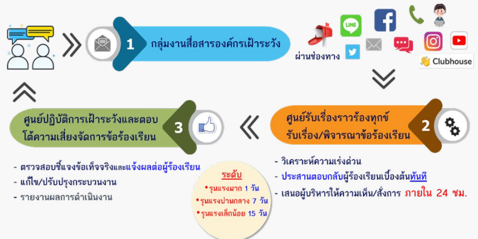
ภาพที่ 2 กระบวนการจัดการข้อร้องเรียน

กรมฯ มีช่องทางการรับเรื่องร้องเรียน ที่สามารถเข้าถึงได้สะดวก ผ่านรูปแบบ Formal ได้แก่ ศูนย์รับเรื่องร้องเรียนของกรม/กระทรวง www.111.go.th และรูปแบบ Informal ได้แก่ สื่อโซเชียล (Facebook Line@ Twitter Instagram YouTube Clubhouse ฟันทิป) website กรมฯ แอปพลิเคชันต่าง ๆ รวมถึงทางโทรศัพท์ และไปรษณีย์ โดยมีการจัดทำมาตรฐานและพัฒนาระบบการจัดการข้อร้องเรียนที่ครอบคลุมทุกกลุ่มผู้รับบริการและผู้มีส่วนได้ส่วนเสีย และกรมยังมีระบบการตอบสนองและสร้างความเชื่อมั่นด้านการแพทย์แผนไทย การแพทย์ทางเลือกและสมุนไพร โดยการทำงานร่วมกับกระทรวงดิจิทัลเพื่อเศรษฐกิจและสังคม และกรมอนามัย ในการเฝ้าระวัง และตอบโต้ข่าวปลอม พร้อมทั้งร่วมชี้แจงประเด็นข้อเท็จจริงสร้างความเชื่อมั่นและสร้างความรอบรู้ด้านสุขภาพ เพื่อให้ประชาชนเกิดความเข้าใจที่ถูกต้อง และเชื่อมั่นต่อศาสตร์การแพทย์แผนไทย และการแพทย์ทางเลือก