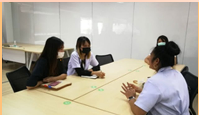
ภาพที่ 8 การส่งเสริมผู้ประกอบการ

กรมฯ ได้จัดตั้งหน่วยงานที่รับผิดชอบด้านการส่งเสริมและพัฒนาศักยภาพผู้ประกอบการโดยตรง ในการส่งเสริมผู้ประกอบการผลิตภัณฑ์สมุนไพร ตั้งแต่กระบวนการปลูกเพื่อเพิ่มมูลค่าทางเศรษฐกิจ การศึกษาวิจัย และการพัฒนานวัตกรรมใหม่ๆ นำมาซึ่งการแปรรูปสมุนไพรไทยให้ได้คุณภาพ มาตรฐานเป็นที่ยอมรับ โดยมีการรับรองผลิตภัณฑ์สมุนไพรที่มีคุณภาพผ่านตราสัญลักษณ์ผลิตภัณฑ์สมุนไพรดีเด่นระดับชาติ (PMHA) และตราสัญลักษณ์รางวัลผลิตภัณฑ์สมุนไพร (Premium Herbal Product) เพื่อขับเคลื่อนนโยบายสมุนไพรสร้างเศรษฐกิจ นอกจากนี้ ยังสนับสนุน ส่งเสริม และเชิดชูเกียรติคุณให้แก่ผู้ประกอบการสมุนไพรคุณภาพ โดยการให้รางวัลเพื่อเป็นขวัญกำลังใจ แก่ผู้ประกอบการและอุตสาหกรรมสมุนไพรไทยเพื่อส่งเสริมให้สมุนไพรไทยมีคุณภาพ มาตรฐาน และเป็นที่ยอมรับในตลาดโลก