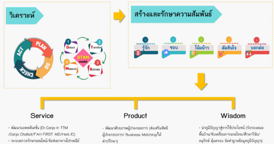
ภาพที่ 1 กระบวนการวิเคราะห์เพื่อนำไปสู่การตอบสนองผู้รับบริการและผู้มีส่วนได้ส่วนเสีย

กรมฯ ได้นำสารสนเทศที่ได้จากผู้รับบริการและผู้มีส่วนได้ส่วนเสีย มาใช้เพื่อปรับปรุงผลผลิตและบริการ เพื่อตอบสนองความต้องการ และทำให้เห็นความคาดหวัง โดยยึดหลัก PDCA และ DTAM Model ตลอดจนสร้างความสัมพันธ์ ให้เกิดการรู้จัก ชอบ โนมน้าว ตัดสินใจ และบอกต่อ เพื่อให้เกิดความพึงพอใจ และสร้างความผูกพัน กับผู้รับบริการและผู้มีส่วนได้ส่วนเสีย จากการรวบรวมและวิเคราะห์ข้อมูล นำมาซึ่งการปรับปรุง และพัฒนาระบบการให้บริการ ตามภารกิจหลักของกรม 3 ด้าน ได้แก่ ด้านการบริการแพทย์แผนไทยและการแพทย์ทางเลือก (Service) ด้านผลิตยาและพัฒนาผลิตภัณฑ์สมุนไพร (Product) และด้านการคุ้มครองภูมิปัญญาการแพทย์แผนไทย การแพทย์พื้นบ้านไทย และสมุนไพร (Wisdom)