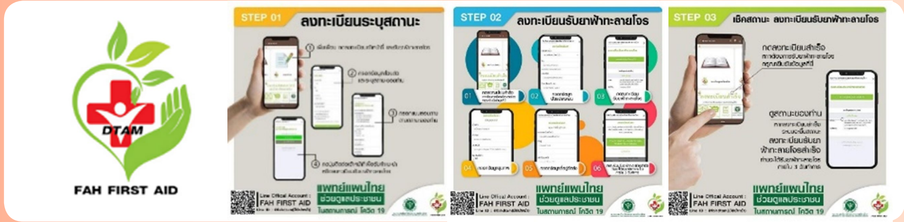
ภาพที่ 5 ระบบ LINE OA : FAH FIRST AID

3) พัฒนาระบบ LINE OA: FAH FIRST AID ช่องทางการติดต่อข้อมูล “สมุนไพรฟ้าทะลายโจร” แบบครบวงจร เพื่อให้ความรู้ด้านสุขภาพในการใช้สมุนไพรฟ้าทะลายโจร แก่ประชาชนที่มีความเสี่ยงในภาวะการระบาดของโรคติดเชื้อไวรัสโควิด-19 ให้สามารถดูแลตนเองเบื้องต้น ลดความรุนแรงของโรค ลดภาระระบบสุขภาพในภาพรวม ซึ่งเป็นการเพิ่มช่องทางการเข้าถึงสมุนไพรฟ้าทะลายโจรที่มีคุณภาพและมีความปลอดภัย เข้าถึงได้ง่าย สะดวก และติดตามผลได้อย่างรวดเร็ว อีกทั้งยังเพิ่มระบบการลงทะเบียนรับยาฟ้าทะลายโจรทางไปรษณีย์โดยไม่มีค่าใช้จ่ายให้กับผู้ป่วยโควิด 19 ที่รอรับการรักษา หรือมีความเสี่ยงสูง มีประวัติสัมผัสผู้ติดเชื้อ