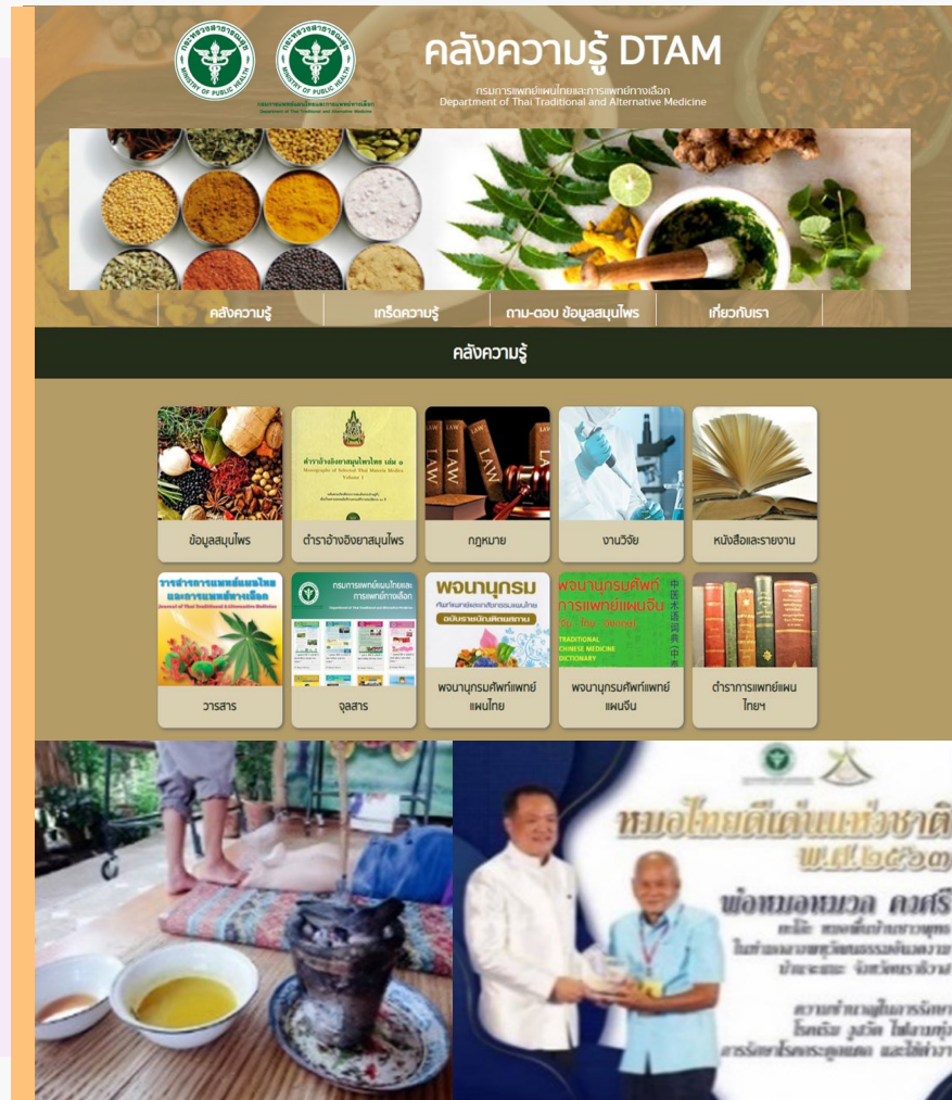
ภาพที่ 9 การนำภูมิปัญญาสู่การใช้ประโยชน์

กรมการแพทย์แผนไทยและการแพทย์ทางเลือก มุ่งหวังให้การแพทย์แผนไทยเป็นที่พึ่งของประชาชน และเป็นทางเลือกในการดูแลสุขภาพในทุกกลุ่มวัย ให้การยอมรับและเชื่อมั่นต่อศาสตร์การแพทย์แผนไทย โดยมีการพัฒนางานบริการที่ต่อเนื่อง และสนับสนุนช่องทางการท่องเที่ยวเชิงสุขภาพ เมืองสมุนไพรแบบอินทรีย์เพื่อเพิ่มการเข้าถึงของกลุ่มผู้รับบริการในอนาคต เช่น กลุ่มนักท่องเที่ยว และชาวต่างชาติ และกรมฯ ยังมีแนวทางในการพัฒนาสู่การเป็น Excellence Center มีการพัฒนางานวิจัย และนวัตกรรม มุ่งให้ประชาชนสามารถเข้าถึงบริการที่เป็นเลิศ อีกทั้งมีการพัฒนาปรับปรุงกระบวนการงานเพื่อให้การแพทย์แผนไทยเชื่อมโยงกับการแพทย์แผนปัจจุบันได้อย่างมีประสิทธิภาพและเกิดประสิทธิผลต่อไป และในด้านภูมิปัญญาการแพทย์แผนไทยนั้น กรมฯ ได้ให้ความสำคัญต่อการสืบสาน รักษา ต่อยอด ภูมิปัญญาสู่การนำไปใช้ประโยชน์ โดยตั้งเป้าหมายภายใน 20 ปีข้างหน้า ประเทศไทยจะเป็นเมืองแห่งสมุนไพรแบบอินทรีย์ เป็นศูนย์กลางความเป็นเลิศที่ครอบคลุมการพัฒนาบริการ การพัฒนาวิจัย และนวัตกรรม ตลอดจนการแพทย์แผนไทย การแพทย์ทางเลือก และสมุนไพร และทำให้การท่องเที่ยวเชิงสุขภาพอยู่อันดับ 1 ใน 7 ของโลกต่อไป