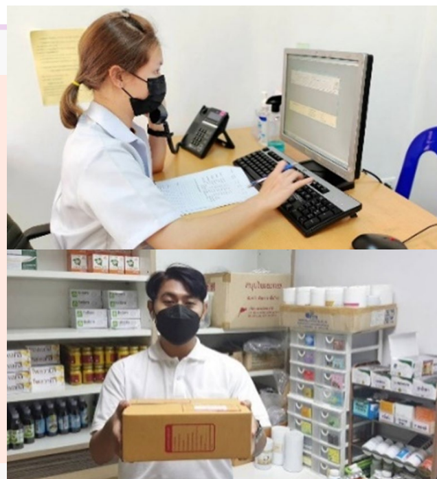
ภาพที่ 7 ระบบการตรวจรักษาออนไลน์/จัดส่งยาทางไปรษณีย์

กรมฯ ได้ให้ความสำคัญกับกลุ่มผู้สูงอายุ ผู้พิการ ผู้ป่วยติดเตียง ซึ่งเป็นหนึ่งในกลุ่มผู้รับบริการหลักของโรงพยาบาลการแพทย์แผนไทยและการแพทย์ผสมผสาน และคลินิกกัญชาทางการแพทย์แผนไทย ในเขตกรุงเทพฯ และปริมณฑล ที่ไม่สามารถเดินทางมารับบริการ ณ สถานที่ที่ตั้งได้ และเพื่อลดความเสี่ยงในการเข้ารับบริการเนื่องด้วยสถานการณ์การแพร่ระบาดของโรคโควิด-19 กรมฯ จึงได้พัฒนานวัตกรรมบริการให้บริการเพื่อตอบสนองต่อความต้องการและทำให้เหนือกว่าความคาดหวัง โดยมีระบบการตรวจรักษาออนไลน์ และจัดส่งยา ผ่านทางไปรษณีย์ในกรณีเป็นผู้ป่วยเก่าที่มีประวัติการรักษาที่โรงพยาบาล กลุ่มผู้ป่วยนอกและผู้ป่วยคลินิกกัญชาทางการแพทย์แผนไทย กลุ่มโรคเรื้อรัง ที่จำเป็นต้องรับยาต่อเนื่องและมีอาการคงที่ไม่มีอาการแทรกซ้อนหรือโรคติดเชื้อร้ายแรง สามารถรับยาในปริมาณไม่เกินครั้งละ 3 เดือน โดยรอรับยาได้ที่บ้าน และชำระค่าจัดส่งยากับทางไปรษณีย์ไทยได้โดยไม่ต้องมารับบริการ ณ สถานที่ตั้ง