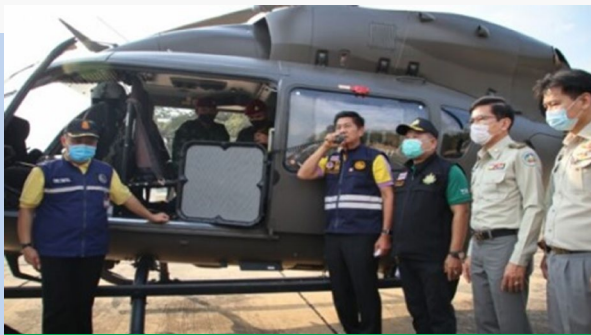
การสำรวจไฟป่าหมอกควัน