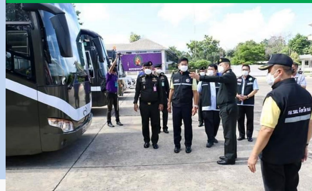
เครือข่ายภายนอกจังหวัด