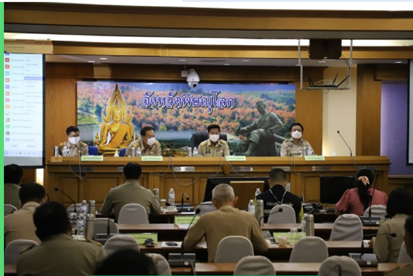
ประชุมชี้แจงส่วนราชการ

ในการถ่ายทอดวิสัยทัศน์ ประเด็นยุทธศาสตร์การพัฒนาจังหวัด ค่านิยม รวมถึงการขับเคลื่อนการพัฒนาจังหวัดในทุกมิติ จังหวัดได้ใช้การถ่ายทอดทั้งในรูปแบบทางการ และรูปแบบไม่เป็นทางการ ร่วมกับการใช้เทคโนโลยีสารสนเทศและการสื่อสาร อย่างมีประสิทธิภาพไปยังทุกภาคส่วนทั้งส่วนราชการ ภาคเอกชน และประชาชน โดยในกลุ่มส่วนราชการ ใช้วิธีการประชุมชี้แจงไปยังหัวหน้าส่วนราชการ และหัวหน้าส่วนราชการถ่ายทอดให้กับบุคลากรได้รับรู้ สร้างความเข้าใจ สร้างความผูกพันและมีส่วนร่วมในการขับเคลื่อน การดำเนินงาน กลุ่มเอกชน ใช้เวทีการประชุม ก.บ.จ. การประชุม กรอ.จังหวัด และกลุ่มจังหวัดรวมถึงการพบปะพูดคุยเพื่อสร้างความเข้าใจ ร่วมกันในแนวทางการพัฒนาจังหวัด กลุ่มประชาชน ผ่านการลงพื้นที่พบปะชาวบ้านอย่างใกล้ชิด ตลอดจนการประชาสัมพันธ์แผนงานโครงการ และภารกิจของจังหวัดให้ชาวบ้านรับทราบผลการดำเนินงานและความสำเร็จเพื่อสร้างความรู้สึกภูมิใจร่วมกัน