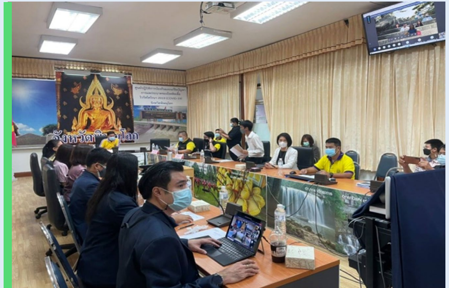
ขับเคลื่อนการดำเนินงานกลุ่มเอกชน