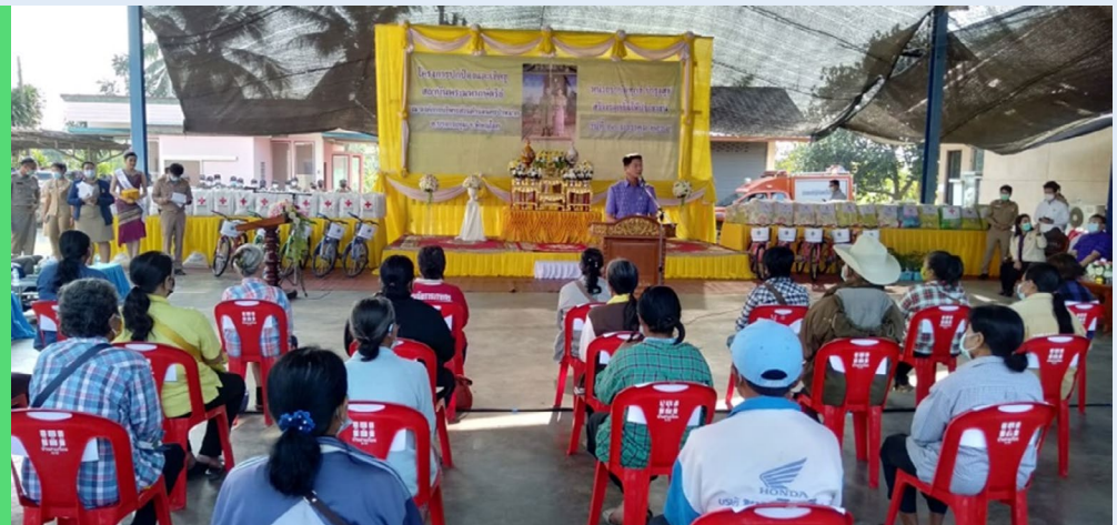
ลงพื้นที่พบปะประชาชน