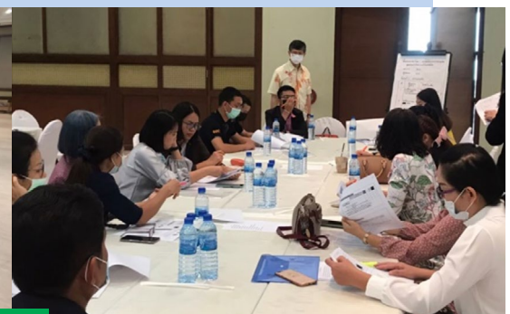
อบรมให้ความรู้การจัดทำแผนบริหารความเสี่ยงการทุจริต

จังหวัดพิษณุโลกขับเคลื่อนการพัฒนาองค์การในมิติต่าง ๆ ควบคู่ไปกับการรับผิดชอบต่อสังคม ผู้ว่าราชการจังหวัดปฏิบัติตนเป็นแบบอย่างในการปฏิบัติราชการตามหลักการบริหารกิจการบ้านเมืองที่ดี โดยได้ประกาศเจตนารมณ์สุจริตในการบริหารงานให้บุคลากรยึดถือในการปฏิบัติราชการตามหลักธรรมาภิบาล และหลักปรัชญาเศรษฐกิจพอเพียง การขับเคลื่อนวาระพิษณุโลกเมืองสะอาด (PHITSANULOK CLEAN & TIDY) การร่วมกับบริษัทประชารัฐรักสามัคคีจังหวัดพิษณุโลกส่งเสริมให้กลุ่มวิสาหกิจชุมชนและกลุ่มผู้ปลูกผักในพื้นที่ 9 อำเภอ ปลูกผักปลอดสารขายให้แก่โรงพยาบาลรัฐและเอกชนสำหรับนำไปทำอาหารให้ผู้ป่วย กระบวนการให้ความรู้แก่บุคลากรของส่วนราชการในเรื่องการทำแผนบริหารความเสี่ยงการทุจริต และส่งเสริมให้ส่วนราชการ จัดทำแผนบริหารความเสี่ยงการทุจริตของส่วนราชการภายหลังการอบรมแล้วเสร็จเพื่อให้บุคลากรนำความรู้ไปใช้ให้เกิดเป็นรูปธรรมอย่างต่อเนื่อง รวมทั้งการสอดส่องการดำเนินงานของหน่วยงานภาครัฐให้เป็นไปตามหลักการบริหารกิจการบ้านเมืองที่ดีอย่างสม่ำเสมอด้วยคณะกรรมการธรรมาภิบาลจังหวัด (ก.ธ.จ.)