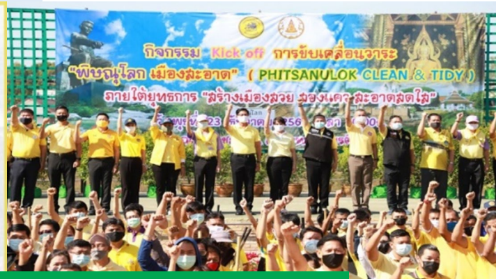
การขับเคลื่อนวาระพิษณุโลกเมืองสะอาด (PHITSANULOK CLEAN & TIDY)