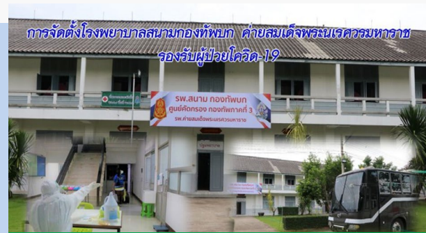
การแก้ไขปัญหาสถานการณ์โควิด