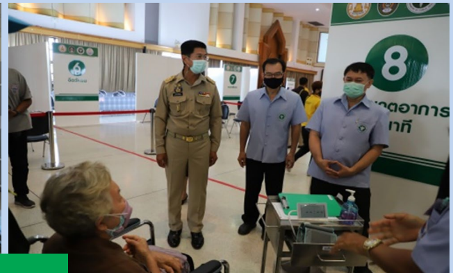
เครือข่ายภายในจังหวัด