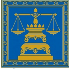
กรมคุ้มครองสิทธิและเสรีภาพ