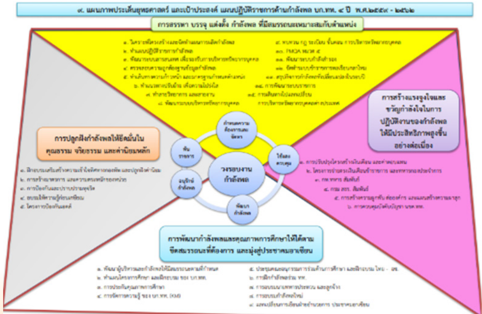
แผนปฏิบัติการด้านกำลังพล บก.ทท. 4 ปี พ.ศ. 2559 - 2562

บก.ทท. ได้ดำเนินการบริหารทรัพยากรบุคคล ผ่านแผนปฏิบัติการด้านกำลังพล บก.ทท. 4 ปี พ.ศ. 2559-2562 ครอบคลุมการดำเนินการด้านกำลังพลของ บก.ทท. ได้อย่างเป็นระบบ โดยการบูรณาการกระบวนการและการเชื่อมโยงระบบสารสนเทศ จำนวน 4 ระบบเข้าด้วยกัน ทำให้เกิดประสิทธิภาพในการดำเนินการอย่างเห็นได้ชัด ทำให้ได้กำลังพลที่เป็น “คนเก่ง” มีความรู้ ความสามารถ “คนดี” ด้วยการปลูกฝังอุดมการณ์ทางทหาร ค่านิยมขององค์การ ปลูกฝังคุณธรรม ทำให้กำลังพลมีความเป็นทหารอาชีพอย่างแท้จริง และสร้างระบบสวัสดิภาพ ให้แก่กำลังพลและครอบครัวอย่างครบครัน ทำให้กำลังพลมีความพึงพอใจ สามารถปฏิบัติภารกิจได้อย่างเต็มกำลังความสามารถ จนเป็นกำลังพล “คนมีความสุข” ในการทำงาน