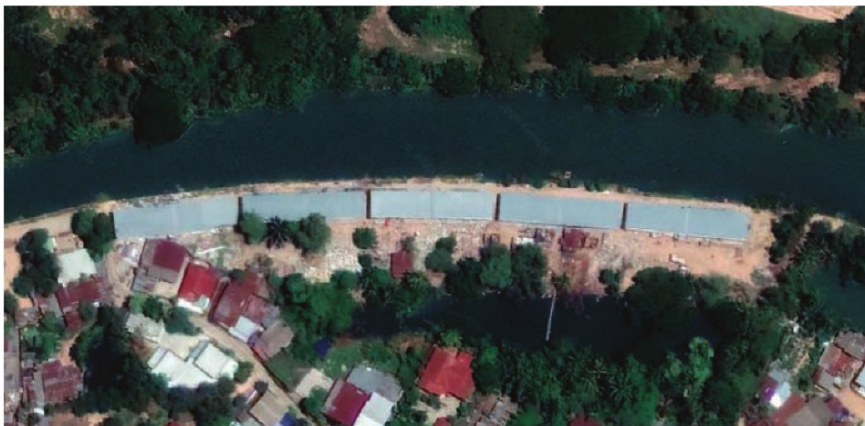
ภาพมุมสูงบริเวณที่พักอาศัยใหม่ที่จัดให้แก่ประชาชนจากพื้นที่บุกรุก

ช่วงปี พ.ศ. 2560 ถึงปัจจุบัน เทศบาลเมืองร้อยเอ็ดได้จัดหาพื้นที่และสร้างที่อยู่อาศัยใหม่ให้แก่ประชาชนในชุมชนแออัดบริเวณพื้นที่บุกรุก โดยในปี พ.ศ. 2560 เทศบาลร่วมกับหน่วยงานราชการและแกนนำภาคประชาชนจัดตั้งคณะกรรมการเมืองเทศบาลเมืองร้อยเอ็ด ผลักดันโครงการบ้านประชารัฐร่วมใจเพื่อผู้ยากไร้ในชุมชนแออัดให้เป็นกลไกหลักในการดำเนินการ และปี พ.ศ. 2562 เทศบาลเริ่มก่อสร้างบ้านตามโครงการและพื้นที่ที่กำหนดไว้ โดยปัจจุบันสร้างเสร็จแล้ว และได้คัดเลือกประชาชนจากชุมชนแออัดบริเวณชุมชนวัดเหนือ 50 ครัวเรือนเข้าอยู่อาศัยเป็นที่เรียบร้อยแล้ว (การคัดเลือกดำเนินการโดยการประชาคมและการพิจารณาของคณะกรรมการเมืองเทศบาลเมืองร้อยเอ็ด) ส่วนพื้นที่ชุมชนแออัดเดิมหลังจากที่ย้ายประชาชนเข้าสู่โครงการบ้านประชารัฐ ทางเทศบาลได้รับคืนเพื่อนำไปใช้ก่อสร้างโครงสร้างพื้นฐานต่าง ๆ ทั้งระบบสาธารณูปโภค ถนน และทางระบายน้ำต่อไป