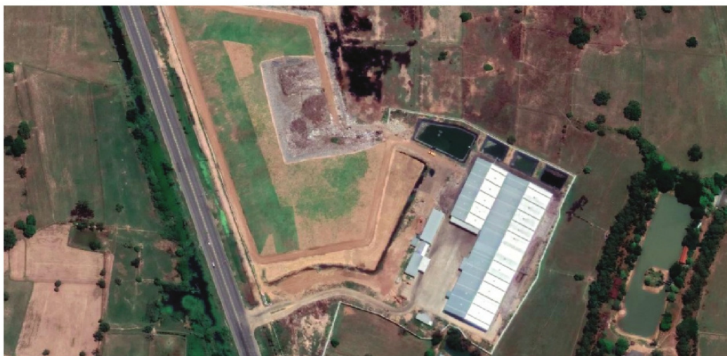
ภาพมุมสูงของสถานีกำจัดขยะมูลฝอยของเทศบาล

การบริหารจัดการขยะปลายทาง คือการบริหารจัดการขยะที่เข้าสู่กระบวนการกำจัดในสถานีกำจัดขยะของเทศบาล และเป็นการจัดการขยะ 1.7 แสนตันที่ตกค้างสะสมในเขตเทศบาลด้วย