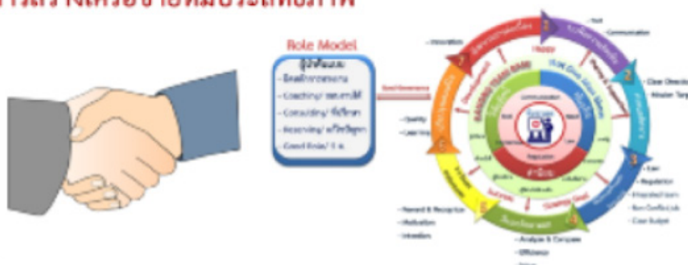
การสร้างทีมระนอง

ขับเคลื่อนการพัฒนาพื้นที่ผ่านการสร้าง “ทีมระนอง” ภายใต้หลักการ Ranong Team base โดยให้ความสำคัญกับทีมงานในทุกระดับ ตั้งแต่ระดับผู้บริหารไปจนถึงระดับผู้ปฏิบัติ ตลอดจนภาคีเครือข่ายทุกภาคส่วน ลดการสั่งการ เพิ่มการขับเคลื่อนงานที่เน้นการร่วมแรงร่วมใจในการปฏิบัติในลักษณะแนวระนาบ สร้างการมีส่วนร่วมอย่างแท้จริง และร่วมกันขับเคลื่อนการพัฒนาจังหวัดระนองให้เกิดประสิทธิภาพ ผลสัมฤทธิ์ตามเป้าหมาย เช่น การนำยุทธศาสตร์สู่การปฏิบัติ