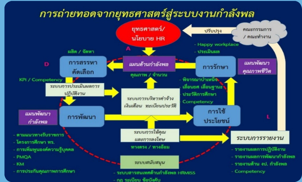
การถ่ายทอดยุทธศาสตร์สู่ระบบงานกำลังพล

การพัฒนากำลังพลให้ตอบสนองต่อยุทธศาสตร์ กองทัพเรือได้ใช้ระบบการศึกษาและการจัดการความรู้เป็นเครื่องมือพัฒนากำลังพลสามารถใช้ประโยชน์จากเทคโนโลยีและศาสตร์ที่มีการพัฒนาอย่างรวดเร็ว ตลอดจนใช้การฝึกในรูปแบบ “รบอย่างไร ฝึกอย่างนั้น” โดยกำหนดเป็น 4 กระบวนการหลัก คือ 1) การสรรหา 2) การพัฒนา 3) การใช้ประโยชน์ และ 4) การรักษา ตลอดจนมีระบบการควบคุมและรายงานผ่านระบบสารสนเทศด้านกำลังพลเพื่อนำไปสู่การปรับปรุงแผนงานด้านกำลังพลต่อไป