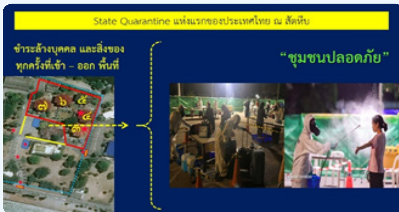
State Quarantine แห่งแรกของประเทศไทยโดยกองทัพเรือ

กองทัพเรือมีความพร้อมและได้รับความไว้วางใจจากรัฐบาลในการจัดตั้ง State Quarantine แห่งแรกของประเทศไทยขึ้น ณ กิจการอาคารรับรองสัตว์ อ.สัตหีบ จ.ชลบุรี ซึ่งได้จัดตั้งศูนย์บัญชาการเหตุการณ์ กรณีการแพร่ระบาดของโรคติดเชื้อไวรัสโคโรนาสายพันธุ์ใหม่ 2019 ณ กองทัพเรือ พื้นที่สัตหีบ ได้ในเวลาอันรวดเร็วและไม่มีข้อผิดพลาด โดยมีการประสานงานกับกระทรวงสาธารณสุขและหน่วยงานความมั่นคงในการให้การสนับสนุนดูแลคนไทยที่กลับจากต่างประเทศ ทั้งจีน เกาหลีใต้ อิตาลี และอเมริกา ตั้งแต่วันที่ 4 กุมภาพันธ์ 2563 นอกจากนี้ ยังสนับสนุนบุคลากรทางการแพทย์และเจ้าหน้าที่ในจัดตั้ง State Quarantine ในพื้นที่กรุงเทพฯ จัดตั้งสถานที่กักกันโรคประจำพื้นที่ (Local Quarantine) ในการคัดกรองโรคในหลายพื้นที่ ตามท่าอากาศยาน ท่าเรือ และด่านชายแดน