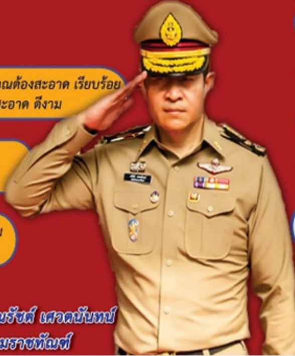
พันตำรวจเอก ณรัชต์ เศวตนันทน์ อธิบดีกรมราชทัณฑ์