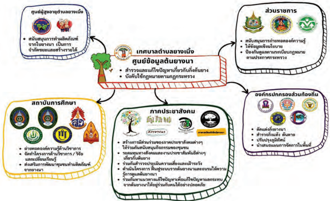
ภาพแสดงองค์ประกอบและบทบาทหน้าที่ของเครือข่ายอนุรักษ์ต้นยางนา

5. การสร้างจิตสำนึกของประชาชนต่อทรัพยากรธรรมชาติ เกิดกระบวนการ การขับเคลื่อนกิจกรรมการอนุรักษ์ต้นยางนาโดยการมีส่วนร่วมของประชาชน โดยการจัด กิจกรรมการอนุรักษ์ต้นยางนา เช่น กิจกรรมการบวชต้นยางนา การจัดกิจกรรมถนนคนเดิน เป็นการสร้างจิตสำนึกและการอยู่ร่วมกันของทรัพยากรธรรมชาติกับชุมชนอย่างได้อย่างยั่งยืน